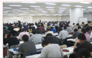
<東京会場サンシャインシティの様子>